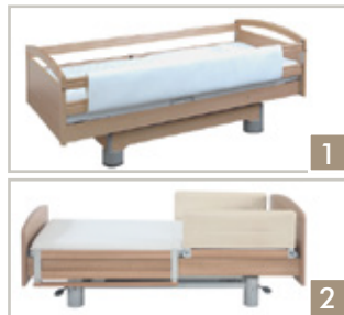
Bedhekpulstering DS (1)bed- hekpulstering GS (2)