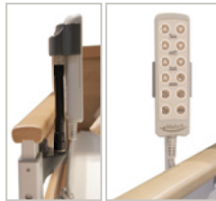
Flexibele houder voor handbediening