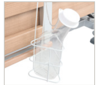
Urinaal met rek