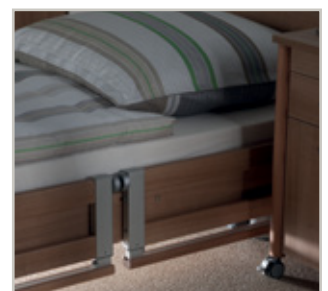
Onderbedverlichting met bewegingssensor