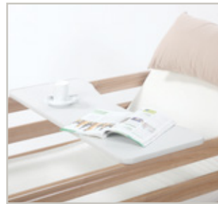
Tafelblad op bed, voor doorlopende bedhekken