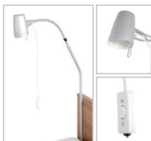
Bedlamp voor plaatsing in uitsparing