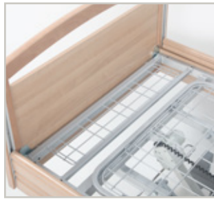
Uitbreiding voor ligvlakverlenging