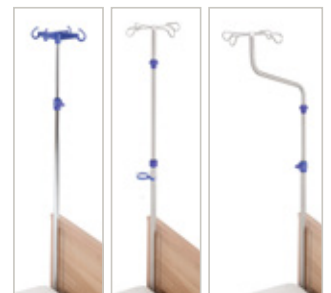
Uitvoering Flesseninzet Recht Kunststof/Edelstaal Gebogen Kunststof/Edelstaal