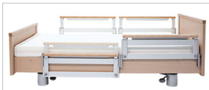
VGS - verticaal verstelbaar gedeeld bedhek (uitschuifbaar)