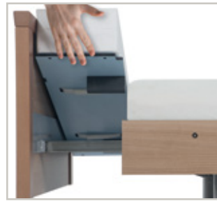
Matrasinlegstuk voor geïntegreerde bedverlenging