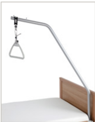
Bedpegeai, handgreep met gesp