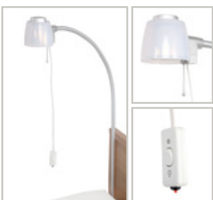
Bedlamp voor plaatsing in uitsparing