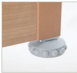
Stootwiel - horizontaal en verticaal