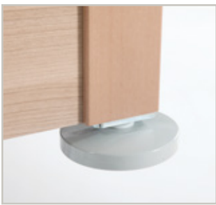
Stootwiel - horizontaal