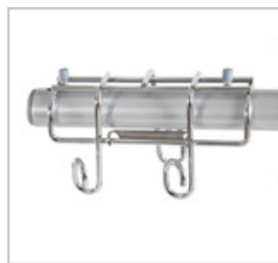
Infuushouder voor bedpegeai