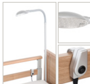
Bedlamp voor plaatsing in uitsparing