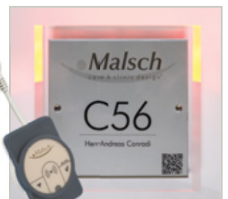
Bed-Exit System (snoerloos)